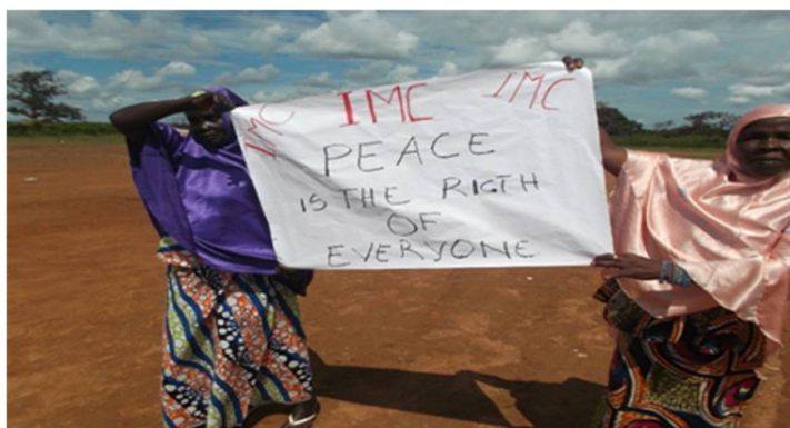
Frauen eine Stimme geben: genderspezifische Friedenskompetenz. Flüchtlingslager Ost-Kamerun

Seit drei Jahrzehnten begleite und moderiere ich Friedensbildung in Afrika. Generationen erleben dort das systematische Versagen des Staates und der öffentlichen Ordnung, ethnische Ausgrenzung, offene Missachtung von Menschenrechten, die Willkür der Ordnungsorgane, politische Manipulation... und Internationale „Friedens“-Truppen, die sich in aller Regel als Teil des Problems erweisen, statt als Katalysator für Sicherheit und Entwicklung. Die leidvolle Erfahrung von Völkermord, Putsch, Partisanenkrieg, Vertreibung und Flucht lehrt die Menschen dort, dass die Idee aus überkommenen Zeiten, „Wenn du den Frieden willst, rüste zum Krieg“ , keinesfalls zum Ziel führt. Und so setzen die Menschen in ihren Dörfern, Genossenschaften, Vereinen, Glaubensgemeinschaften der waffen-strotzenden Gewalt von Krieg, Rebellion und Ausgrenzung beharrliche Aktionen des sozialen Zusammenhalts, der gesellschaftlichen Teilhabe und der Versöhnung entgegen.