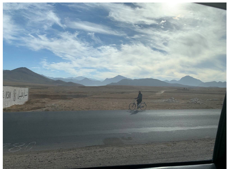
Afghanistan quo vadis?