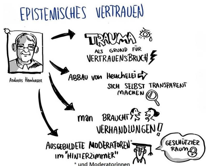
Zeichnung: Natalia Solodovnikova, Munich Peace Meeting 2021

Zentral jedoch ist politische Kleinarbeit. Politische Vertrauensbildung beginnt im Gemeinderat oder in der Bürgerversammlung, wo es um Probleme geht, die nah bei den Menschen sind, und wo die Erfolge und Misserfolge schnell sichtbar werden. Zivilgesellschaftliche nationale und internationale Initiativen – wie zum Beispiel auch das Munich Peace Meeting – bilden die Humusschicht, in der Vertrauen wächst. Auch psychoanalytische Politikberatung und Konfliktmediation können zur Vertrauensbildung beitragen.