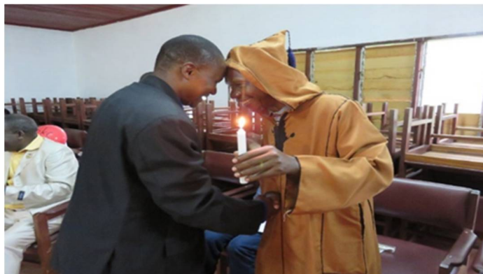
Was die MSC (noch?) nicht kann: Mediation und Empathie. Die Interreligiöse Plattform, Zentralafrikanischen Republik

zusetzen, auch nach der Konferenz begleitet? Das sind die Fragen, die wir, motiviert aus der Friedens- und Sicherheits-Praxis (nicht nur) afrikanischer Zivilgesellschaft, stellen können und die wir mit Vorschlägen an die MSC für eine veränderte, positivere Praxis hinterlegen.