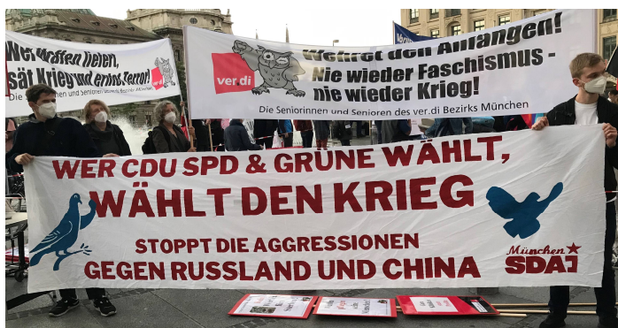
Plakat auf Demo zum Antikriegstag 2021 in München

Es ist schon fast grotesk, dass das so genannte 3%-Ziel , das Wolfgang Ischinger öffentlich propagiert hatte und das wir in Gesprächen mit ihm immer wieder argumentativ kritisiert hatten, jetzt von der Ampelkoalition übernommen wurde. Es heißt zwar, 3% des BIP seien für „internationales Handeln“ bestimmt, dazu gehört „Verteidigung“, Außenpolitik, Krisenprävention und Entwicklungszusammenarbeit, aber an anderer Stelle steht, „die NATO-Fähigkeitsziele wollen wir ... erfüllen“. Indirekt bedeutet das also die Zusage des 2%-Zieles der NATO .