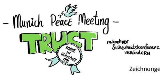
Zeichnungen: Natalia Solodovnikova

Am 16.11.21 fand unser 3. Munich Peace Meeting statt. Zum Thema „Trust Made in Germany - Vertrauensbildung in Zeiten großer Unwägbarkeit“ trafen sich rund vierzig geladene Expert*innen aus Friedenswissenschaft, Friedensarbeit und Friedensbewegung zum Austausch mit dem MSC-Team. Die Moderation durch M. Pröstler (orgwerk) und das grafische Protokoll von N. Solodovnikova trugen wesentlich zum Gelingen der Veranstaltung bei. In zwei Workshop-Blöcken wurde u.a. beratschlagt über „Epistemisches Vertrauen - Psychoanalyse und Politik“, „Das Projekt