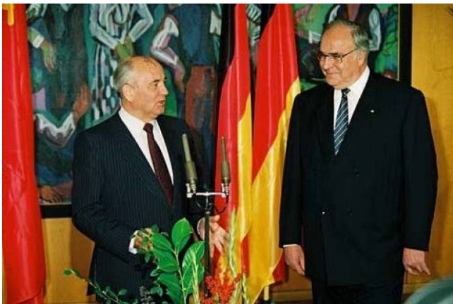
Kohl und Gorbatschow in Bonn November 1990