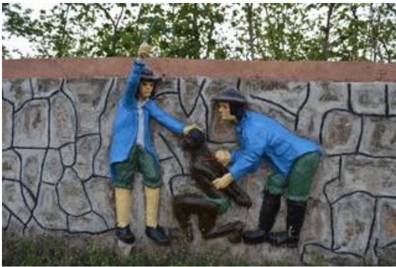
Denkmal zur Erinnerung der Versklavung von den Schwarzen am damaligen Markt der versklavten Menschen in Savalou, Benin „Ein versklavter Mensch wird am Rücken mit einem glühenden Eisenstück markiert“.

Seit dem Ende des Ost-Westkonfliktes erleiden viele ehemalige Kolonien weitere bewaffnete Konflikte, die nicht immer mit politischen Ideologien verbunden sind, sondern von Geopolitik und „Rohstoffsicherung“ abhängen. Besonders in afrikanischen Ländern führt die Jagd nach Ressourcen seitens der Industrieländer dazu, dass bewaffnete Konflikte „proviziert“ oder die existierenden Konflikte in Gang gehalten werden. Natürlich geschieht dies nicht ohne die Unterstützung von lokalen politischen Kräften und Kollaborateuren. Außerdem führen noch heute Negrophobie und Rassismus, genau wie in der Zeit der Versklavung der schwarzen Menschen zu einer Verschärfung der Konflikte und zu der Banalisierung ihrer Folgen.